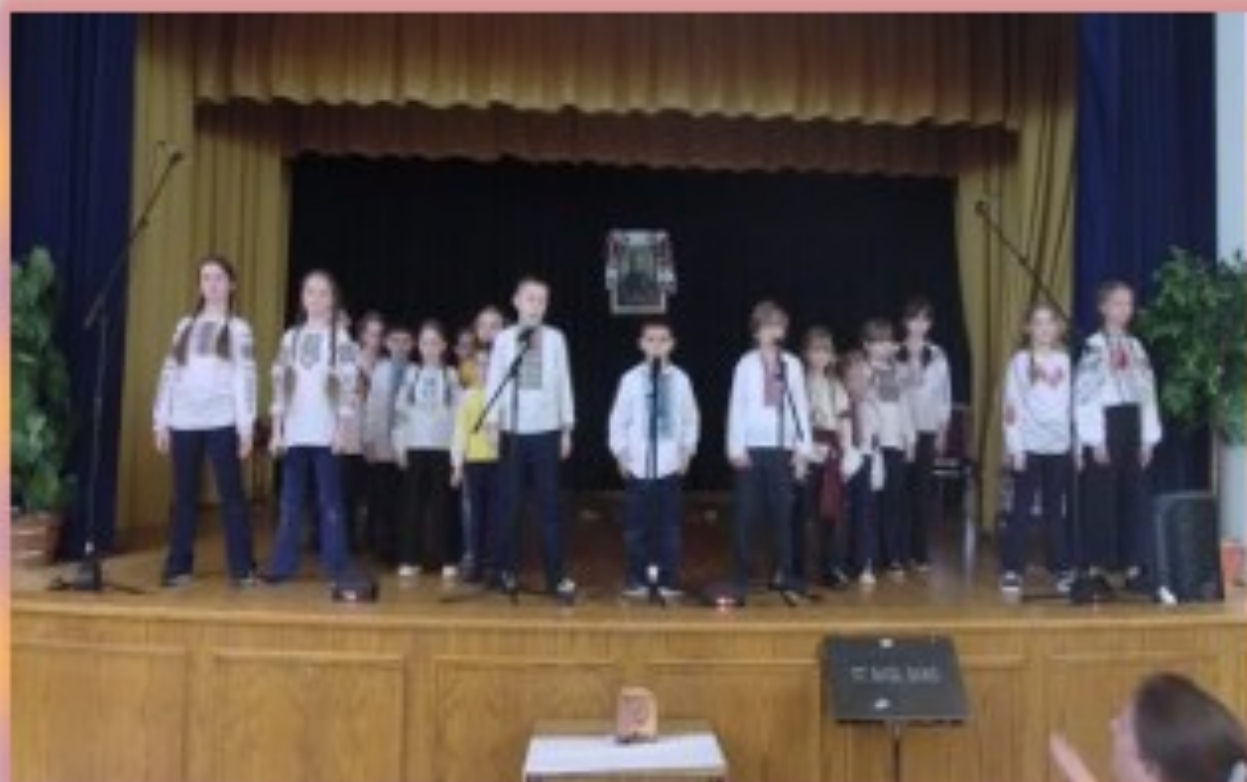
Студія "Act and Shine"