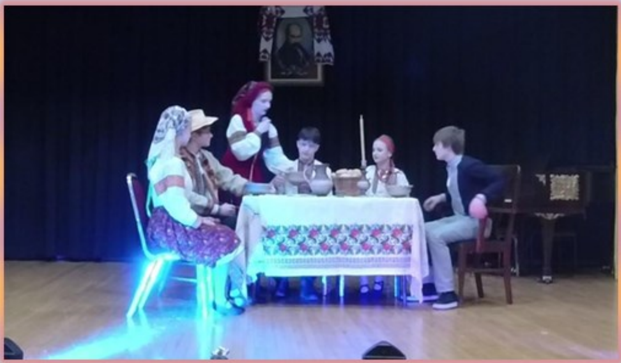
СУМК - "Залізні стовпи"