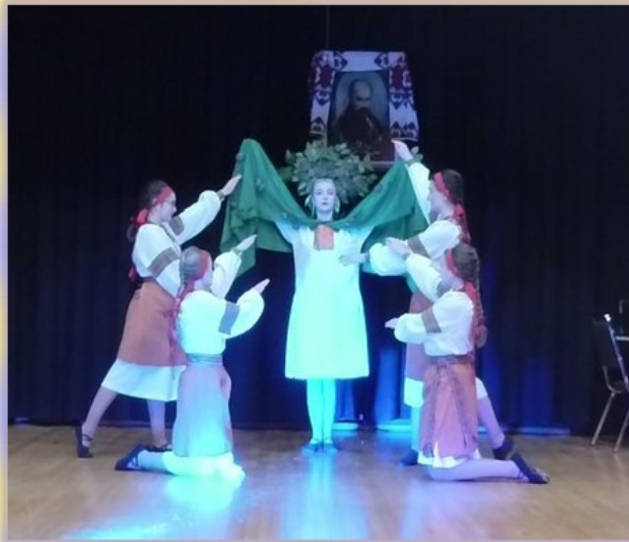
СУМК - "Тополя"