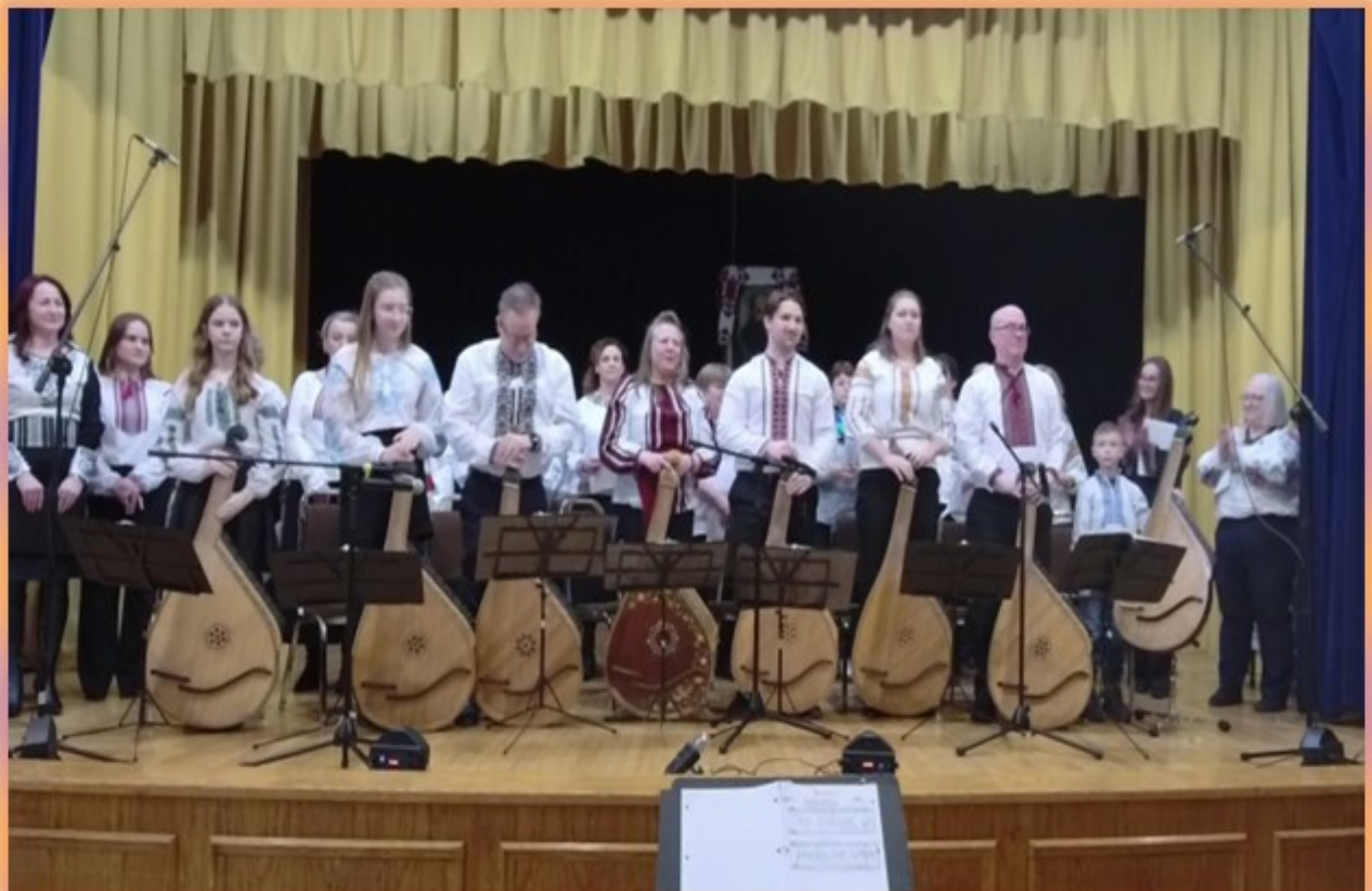
Церковний хор та школа бандуристів